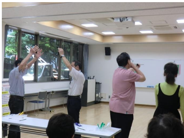
インストラクターの方から指導を受けている様子