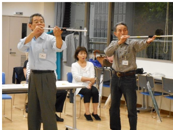
高得点をねらい熱心に練習を重ねました。