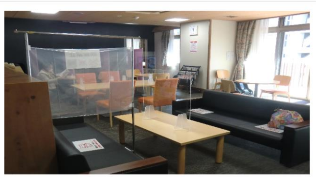
くつろぎのラウンジ